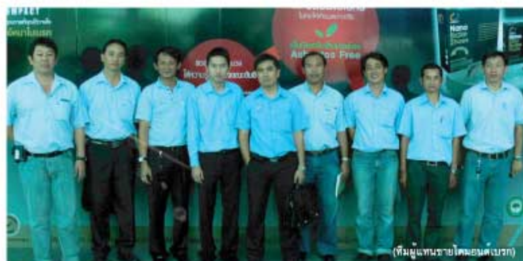
(ทีมผู้แทนขายโตคอมเบรก)

Q: แผนการตลาดของสินค้า Compact Nano Infinity เป็นเช่นไร A: การทำตลาดของ Compact Nano Infinity นั้นได้แบ่งออกมาเป็นหลายส่วน แต่หลักๆจะมีอยู่ 2 ส่วนคือ การประชาสัมพันธ์ และทีมงานในการจำหน่ายสินค้า ซึ่งบริษัทได้มีการเตรียมความพร้อมมาเป็นอย่างดี ไม่ว่าจะเป็นการโฆษณาประชาสัมพันธ์ทางสื่อต่างๆ เช่น นิตยสาร แบนเนอร์ ทีวี ฯลฯ โดยสื่อต่างๆจะทยอยออกมาแนะนำสินค้า ตามระยะเวลาที่ได้ถูกกำหนดเอาไว้ อีกส่วนหนึ่งคือ ทีมงานขายที่มีการอบรมความรู้ผลิตภัณฑ์ Compact Nano Infinity เพื่อสร้างความมั่นใจในการจำหน่ายสินค้า และการตอบคำถามข้อสงสัยในผลิตภัณฑ์ต่างๆ ได้เป็นอย่างดี