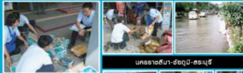
บกระสาป่า-ช่อฤๅ-สรบุรี