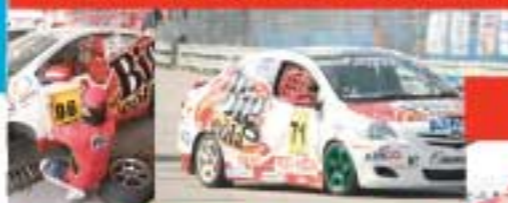
สนามที่ 2 ทุ่งศรีเมือง อุดรธานี