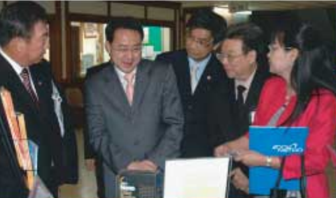
คอมแพ็คเบรกได้รับเกียรติให้การต้อนรับที่งาน > มอเตอร์โชว์ 2010 ออโต้โชว์ เอเชียตะวันออกเฉียงใต้