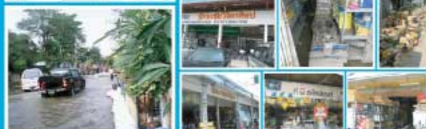
อ่าวทอง-สุพรรณบุรี-อยุธยา-สระบุรี