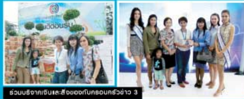
ตัวแทนบริษัทจากเขต: สี่ง ๐๐๐๗ กับครอบครัวยาว 3